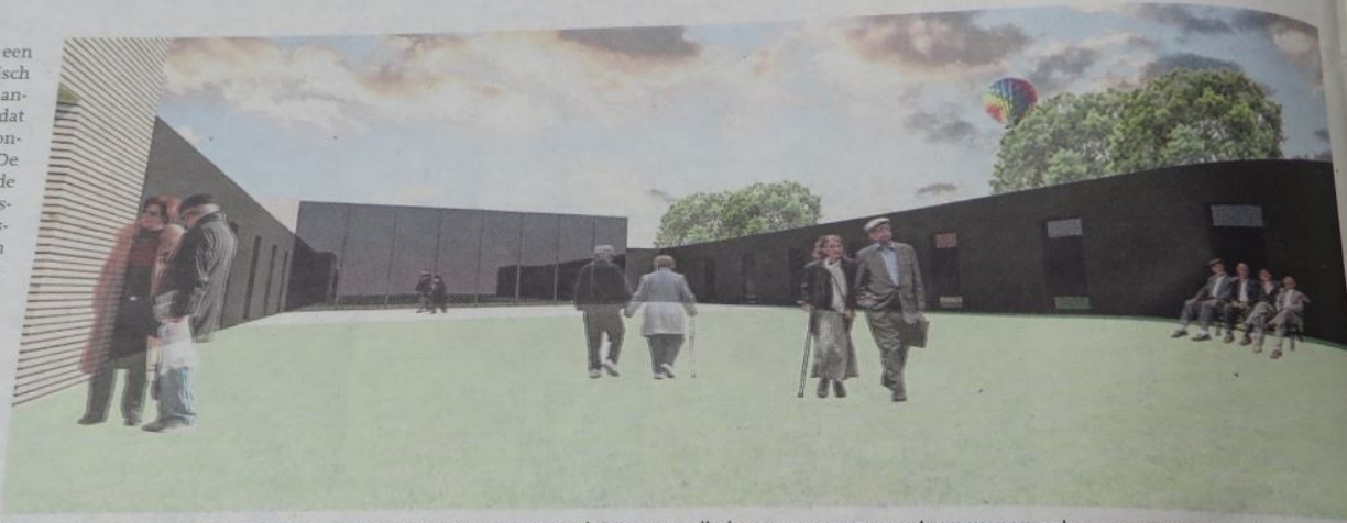
Er wordt bewust gekozen voor één bouwlaag. "Omdat we weten dat mensen die in een woonzorgcentrum wonen ook graag naar buiten kijken." (GF)

Toen de groep Fievez-Beyens een paar jaar geleden de site Medisch Instituut in de Bruggestraat aankocht, werd meteen duidelijk dat de groep daar een nieuw woonzorgcentrum wou inplanten. De groep heeft in Groot-Menen al de rusthuizen Leiezicht in de Murisonstraat in Rekem, Marie-Astrid in de Kortrijkstraat in Menen en Hortensia in de Dronckaertstraat in Lauwe. Daarnaast hadden ze ook residentie Marie-Paule in de Leopoldstraat in Menen, maar dat woonzorgcentrum beantwoordde niet meer volledig aan de voorwaarden. Ondertussen had de groep ook de 45 bedden van het rusthuis Residentie Riviere opgekocht. "De site Medisch Instituut is een vrij groot domein dat heel veel mogelijkheden biedt. Het is een zone voor gemeenschapsvoorziening waar we in principe tot vijf verdiepingen hoog mogen bouwen. Dat ligt vast in de bouwvoorschriften van de stad. We kiezen hier echter voor een gebouw met slechts één bouwlaag. We beseffen heel goed